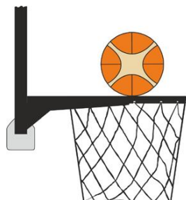
Figure 2 : Ballon en contact avec l'anneau

Il y a intervention illégale par un joueur défenseur ou attaquant si, lors d'un tir au panier, un joueur touche le panier ou le panneau alors que le ballon est en contact avec l'anneau et qu'il a encore la possibilité de rentrer dans le panier.