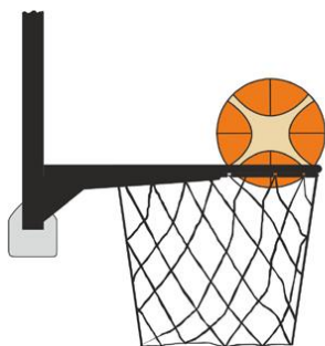
Figure 3 : Ballon dans le panier

Il y a violation pour intervention illégale si un joueur défenseur touche le ballon quand il est dans le panier.